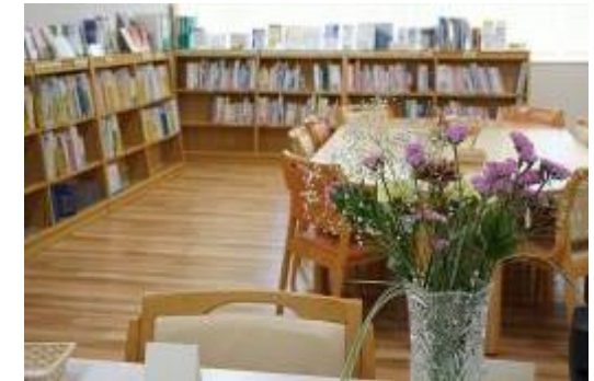
大森病院 2号館 3階 MAP